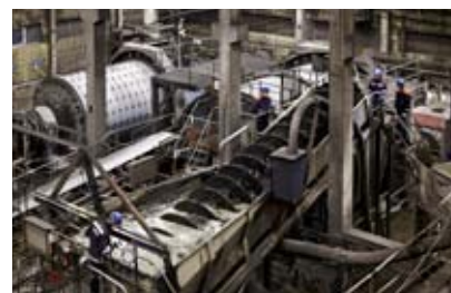
Finmaling för högsta renhet.