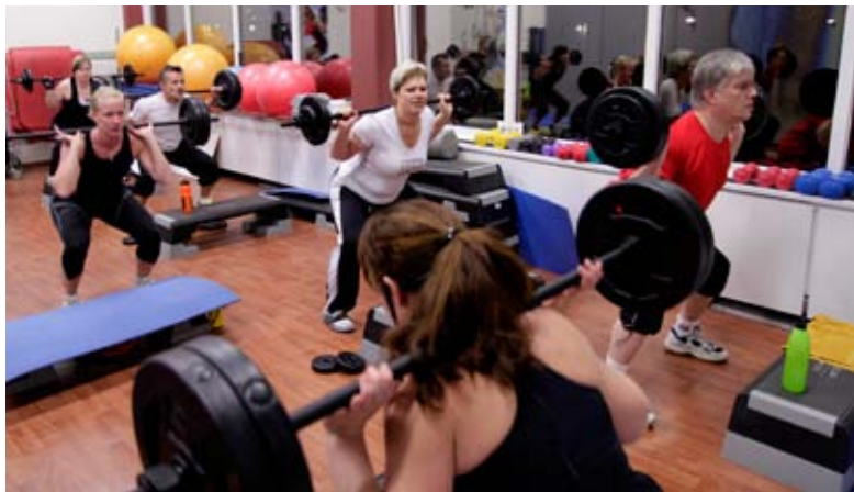
Body pump är en form av muskelkonditräning i grupp. Det som krävs för ett pass är en step-upbräda och en skivstång.