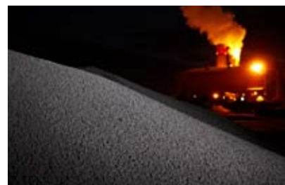
Färska pellets från Mertainen på väg till LKAB:s pilotmasugn.