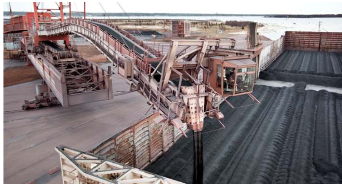
Pråmen Kalla gick med sista båtlasten MAF från Luleå den 16 november.