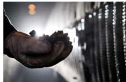
Magnetseparation renar malmkoncentratet.