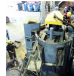
Flotation är ett sätt att rena malm från alkalier och kisel.