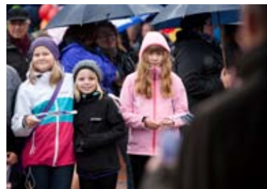
Invigningen lockade såväl gammal som ung.

Besökarna fick en presentation av parkens konst signerad länsmuseumchefen Curt Persson och musik av eleverna vid det Estetiska programmet på Hjalmar Lundbohmsskolan. I mattälten fanns det även möjlighet för gästerna att ta del av en utställning som eleverna i klass 6O på Tuolluvaaraskolan tagit fram med idéer och förslag till Gruvstadsparken.