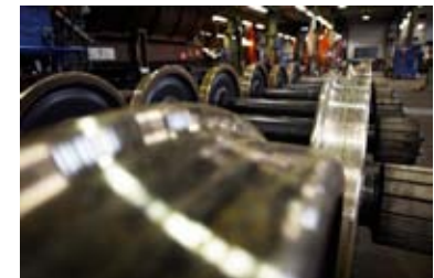
I första hand sker svarvningar av hjulen.