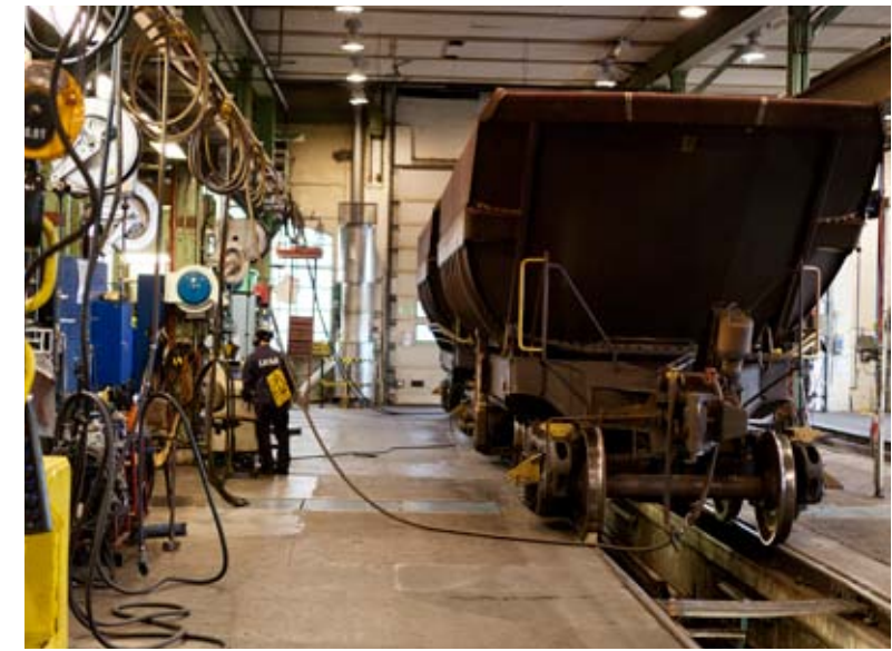
Vagnarna har rullat cirka 150 000 kilometer när de kommer in för hjulunderhåll till lok- och vagnverkstäderna i Kiruna.