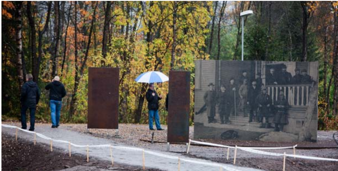
Gångstråket genom Gruvstadsparken i Kiruna ska kantas av konstverk. Här ett motiv av fotografen Borg Mesch.