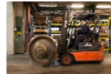
Ett hjul kommer lastat.