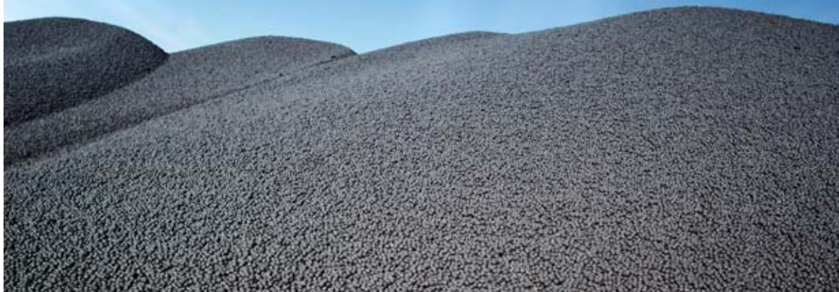
Pelletslager i Malmberget har sålts till andra kunder i Europa.