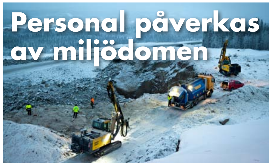
Hundra anställda jobbar i dagbrottet. Stor kompetens har utvecklats.