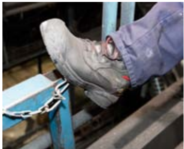
En känga på jobbet kostade en sjukskrivning på 4 veckor. Nu drar underhållet vid pelletsverket lärdom av vardagshändelsen.