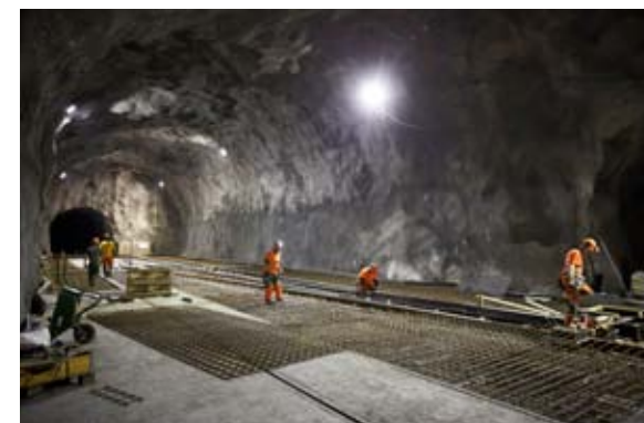
För att 800 personer ska kunna arbeta samtidigt krävs såväl ordning och reda som säkerhet och god sammanhållning på KUJ 1365.