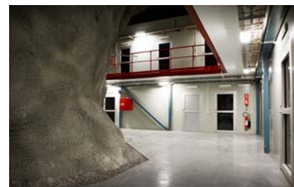
Nya, fräscha kontorslokaler.