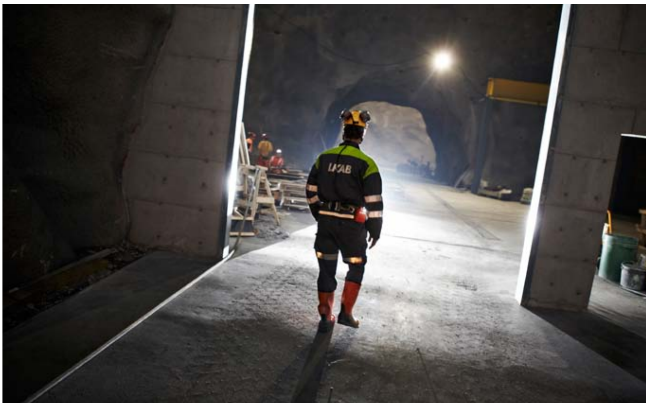
Den första etappen omfattar idrifttagning av tre tappgrupper, 12 bergschakt, tre lok, två vagnset, en kross, ett bergspel, en uppfodringslinje samt styrsystem och övrig media.