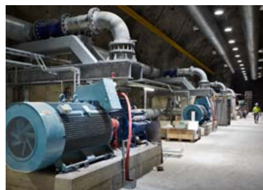
Pumpstation på KUJ 1365.