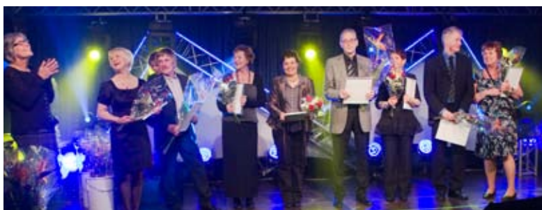
156 veteraner hyllades på Veteranfesten i Nordan, Malmberget.