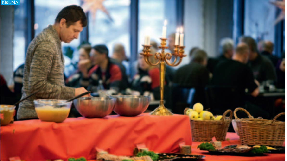
LKAB:s julförd 2011, på restaurang Magnetiten.