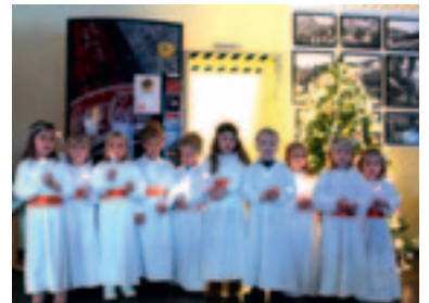
Helt siden LKAB i Narvik fikk siden egen foreldredrevet barnehage, "Malmklumpen Barnehage" i 1984, har det vært en årlig tradisjon med Lucia-besøk i kantina i Mannskaphuset. Førskolegruppe kommer på hyggelig besøk. Synger Lucia-sangen og andre julesanger og byr på hjemmelagde lusekatter.