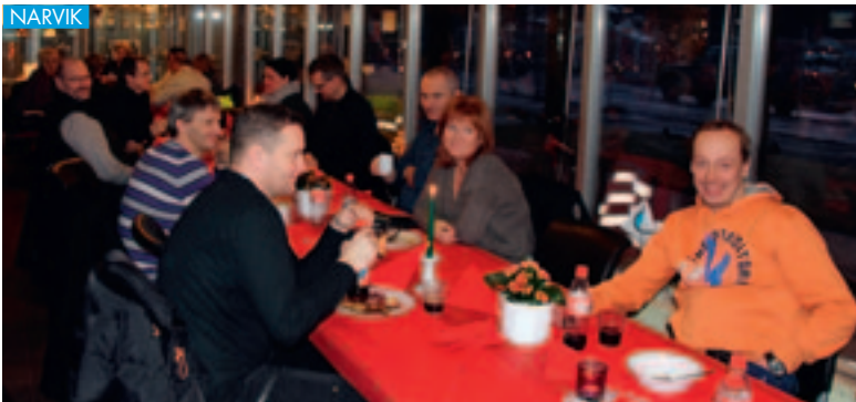
I en årrekke har LKAB hatt tradisjon med å servere julemat til samtlige ansatte i Narvik. Skifgående personell i LKAB og MTAS får matservingen tilpasset skiftgangen, mens alle daggående fikk smakfull ribbe med sprø svor og nydelig riskrem servert i ei flott pynta kantine sist torsdag.