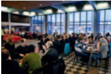
Som vanligt var restaurangen välfylld.